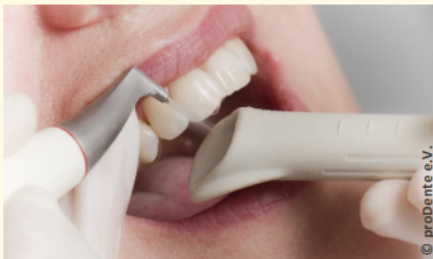
Zahnreinigung mit Pulverstrahlgerät

Auch wer seine Zähne regelmäßig und sorgfältig putzt, erreicht nicht alle Zahnoberflächen. Das sind vor allem die Stellen unter dem Zahnfleisch, in manchen Zahnzwischenräumen und die sehr feinen Grübchen auf den Kauflächen.