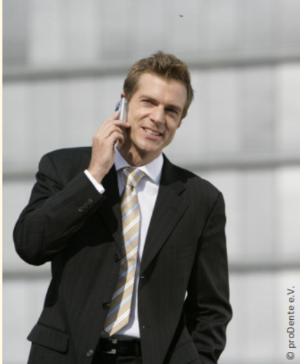
Selbstsicher mit gepflegten Zähnen

Dann werden Mund, Zähne und Zahnfleisch untersucht. Die Zahnbeläge werden angefärbt, um sie besser sichtbar zu machen und es wird die Tiefe der Zahnfleischtaschen gemessen.