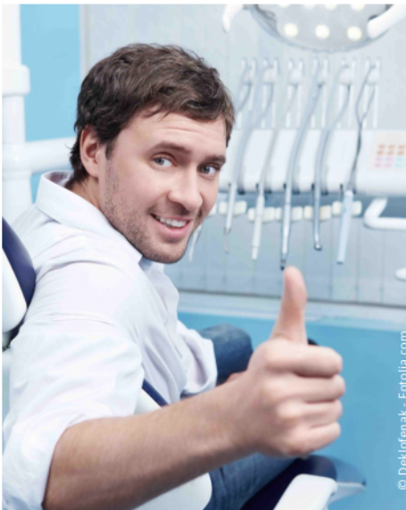
Gesunde Zähne in jedem Lebensalter dank regelmäßiger Professioneller Zahnreinigung