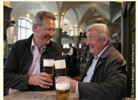
Fest sitzende Zähne: Ein gutes Gefühl!

Stellen Sie sich vor, wie es ist, wenn Sie wieder kraftvoll abbeißen und gut kauen können. Freuen Sie sich an Ihrer neu gewonnenen Sicherheit im Umgang mit anderen Menschen.