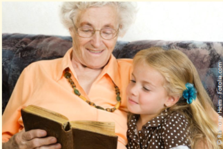
Sicher und unbefangen sprechen mit gut sitzenden Zähnen

Menschen jeden Alters wollen heutzutage aktiv am Leben teilnehmen: In ihrer Familie, im Freundeskreis und bei gesellschaftlichen Anlässen. Dazu gehört auch, dass man sich sicher fühlen beim Essen, Reden und Lachen.