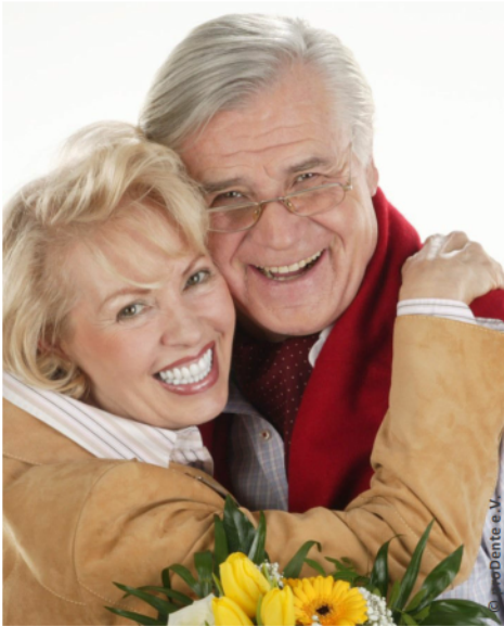
Mehr Lebensfreude und Sicherheit mit Implantaten

Probleme mit schlecht haftenden Zahnprothesen?