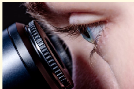
Wurzelbehandlung mit Hilfe des Mikroskops: Bis zu 25-fache Vergrößerung ermöglicht exakteres Arbeiten und bessere Ergebnisse.

Wurzelkanäle sind nur wenige Zehntelmillimeter dünn. Sie können Verästelungen, Krümmungen oder Stufen haben. Mit bloßem Auge sind solche Feinheiten nicht erkennbar. Deshalb werden sie leider oft übersehen.